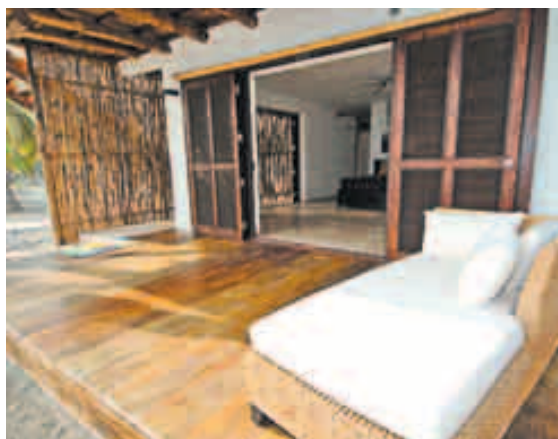
LAS HABITACIONES poseen puertas de cristal que permiten apreciar el bello panorama.

Para los que desean practicar la pesca artesanal, la tarifa es más cómoda: $50 (más la gasolina) medio día; y $90 (más la gasolina) el día completo. En este caso, los viajeros no deben ser más de cuatro.