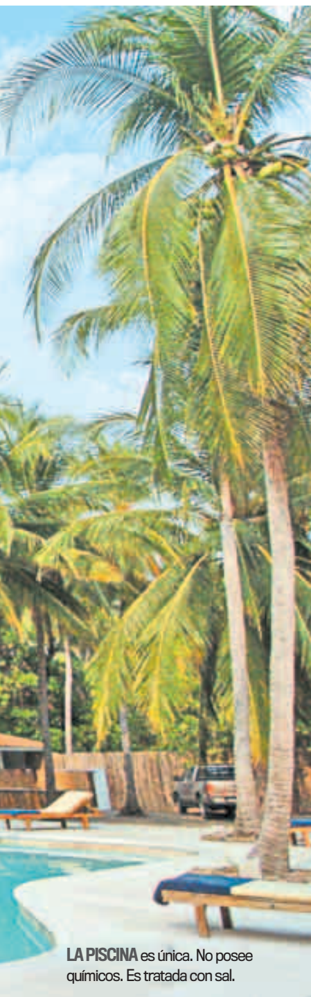
LA PISCINA es única. No posee químicos. Es tratada con sal.