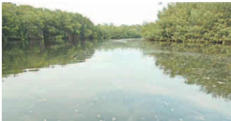
LOS VIAJES por los manglares son espectaculares. El paisaje cautiva a toda hora.

reside en que la primera posee una cama King Size y la segunda, dos individuales.